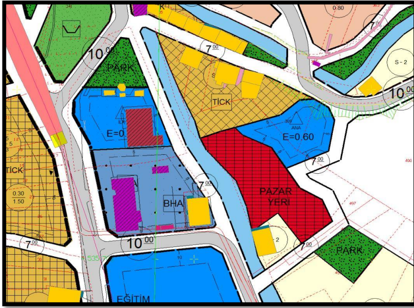
Şekil 3-Meri imar planı

Planlama alanının batısından 10 metrelik imar yolu, ortasından dere geçmektedir. Derenin doğusunda eğimli topografyada Pazar Yeri fonksiyonu yer almaktadır. Pazar Yeri, plan kurgusuna göre güneyinden geçen 7 metrelik imar yolu ile hizmet almaktadır.